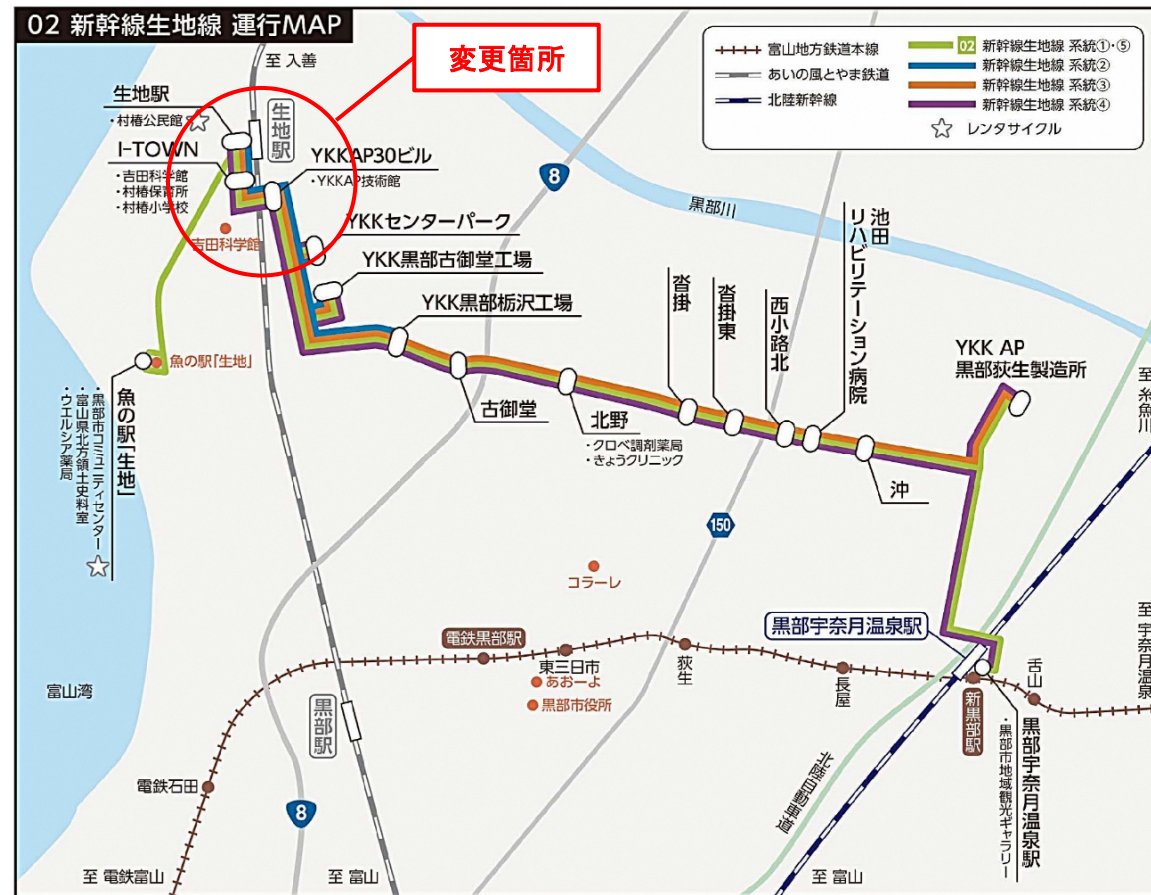
運行経路変更箇所（新幹線生地線）