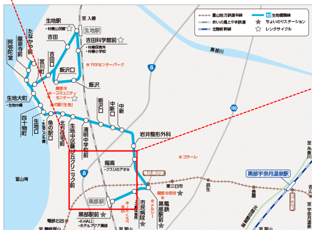
図 生地循環線延伸ルート素案