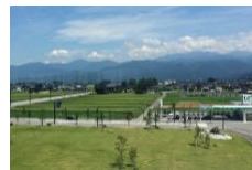
立山連峰の景観に配慮したまちづくり

黒部宇奈月温泉駅周辺地域において、地元住民により、「 景観協定 」を締結。建築物の用途や高さを規制。