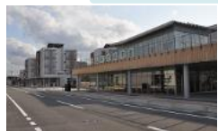
YKKが整備しているパッシブタウン

居住誘導区域内の人口を約 1,400人 増加 (居住誘導区域内の将来人口推計値の約3割に相当)