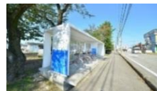
ちよいのり黒部とちよいのりステーション

「 ちよいのり黒部 」(シェアサイクル)を導入 バス停留所に併設したちよいのりステーションを市内5箇所に設置